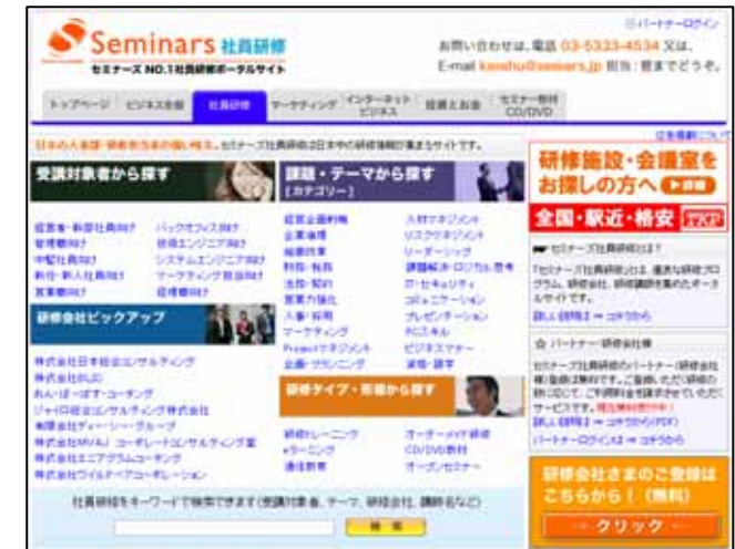
< サイトイメージ >

No.1セミナーポータルサイトを築いたセミナーズが、新たな挑戦に挑みます。セミナーズからの生きたナレッジを活用し、研修のNo.1ポータルサイトを築きます。社員の成長のため、会社を強くするため、日本をさらに発展させるため。セミナーズが本気で取り組みます。まずは、日本一から。