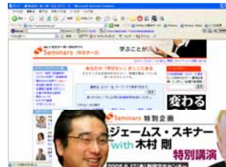
セミナーズ トップページ